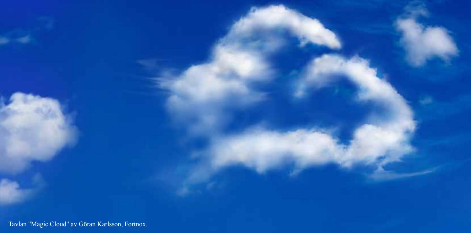
Tavlan "Magic Cloud" av Göran Karlsson, Fortnox.